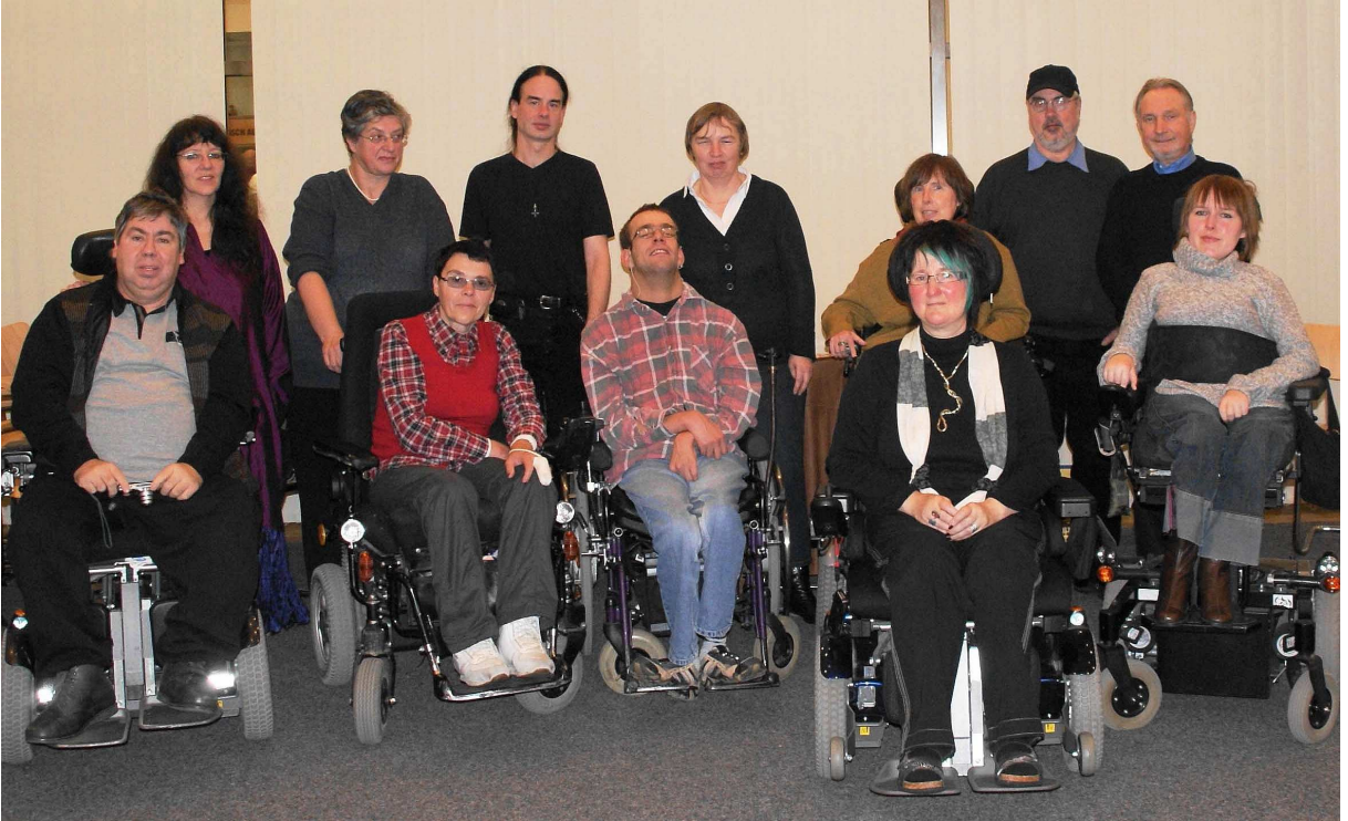
Teilnehmer und Teilnehmerinnen des ersten Durchganges der Fortbildung