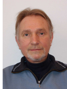
Projektkoordination: Dipl.-Sozialpäd. Gisbert Rimkus