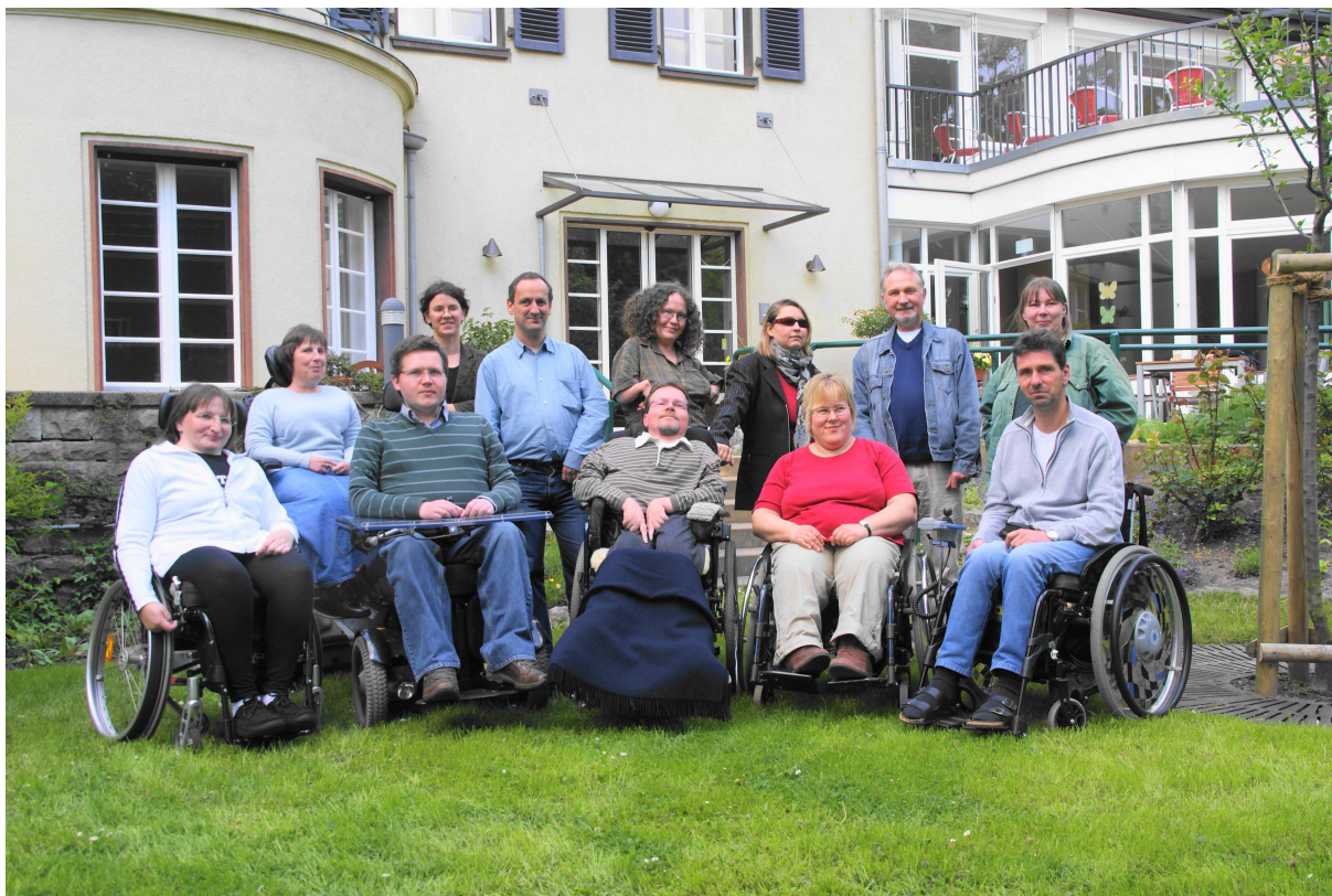
Teilnehmer und Teilnehmerinnen des zweiten Durchganges der Fortbildung

Der letzte Block wurde noch durch den Vortrag eines Mitarbeiters von careNetz aus Schleswig-Holstein ergänzt. Den Kontakt zu careNetz hatte die Referentin hergestellt. Der Vortrag zeigte auf sehr eindrückliche Art die Umsetzungsmöglichkeiten des Trägerübergreifenden Persönlichen Budgets im Bereich berufliche Teilhabe.